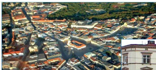
Původní sídlo společnosti v centru Olomouce